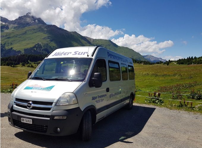
Der Bus alpin auf der Alp Flix