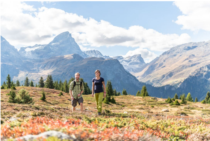
Artenreiche Lebensräume zu entdecken: Alp Flix