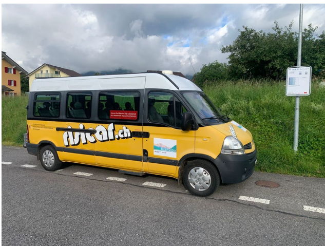
Bus alpin Lütholdsmatt in Alpnach Dorf