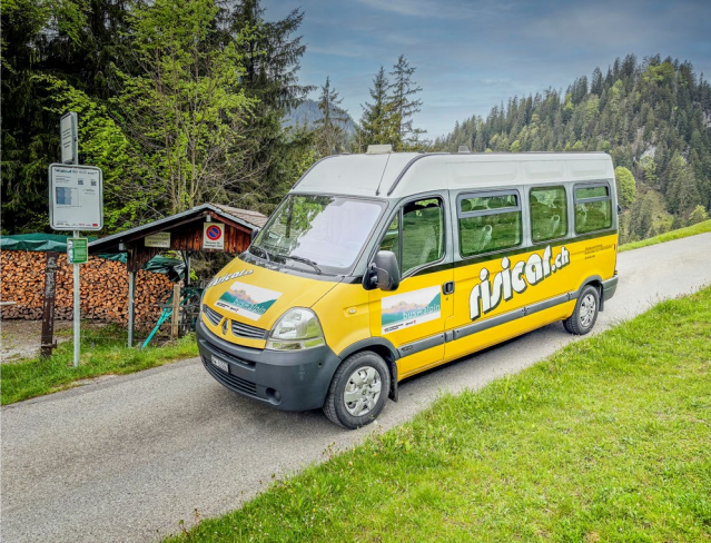
Bus alpin Lütholdsmatt – betrieben von Risicar GmbH