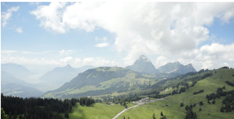
Mythen und Passlandschaft Ibergeregge