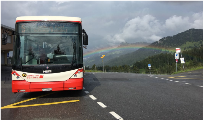
Der Ibergeregge-Bus im Einsatz in der Mythenregion