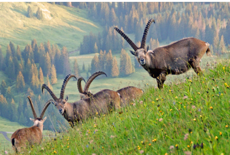
Wildtiere beobachten in der Region Habkern-Lombachalp (zvg)