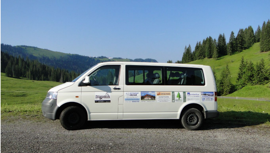
Mit dem Bus alpin unterwegs