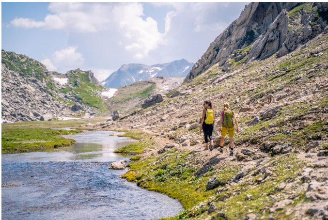
Greina-Hochebene: Ziel zahlreicher Wanderungen