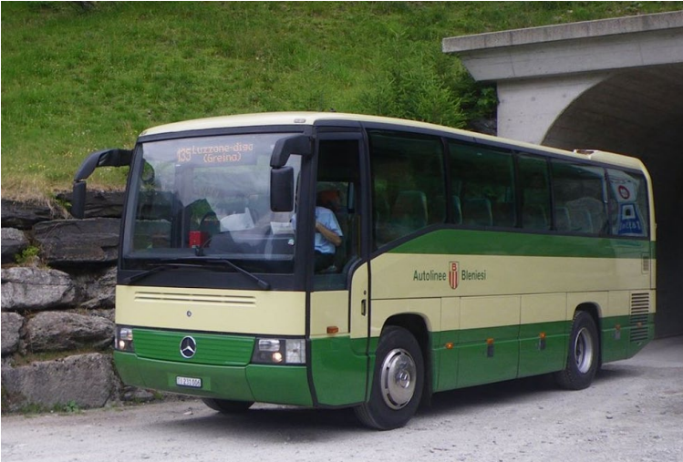
Valle di Blenio: Der Bus alpin fährt im Herbst eine Woche länger