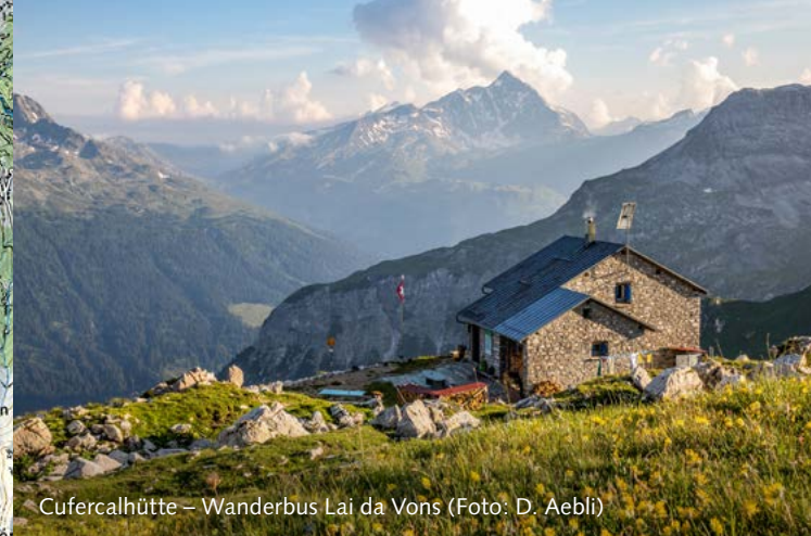
Cufercalhütte – Wanderbus Lai da Vons