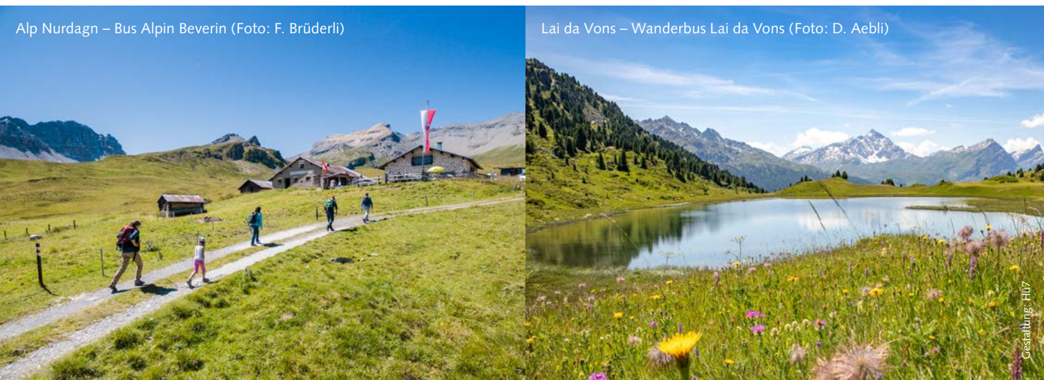
Alp Nurdagn – Bus Alpin Beverin

Gaudenz AG Andeer +41 81 630 75 75 www.gaudenz-ag.ch