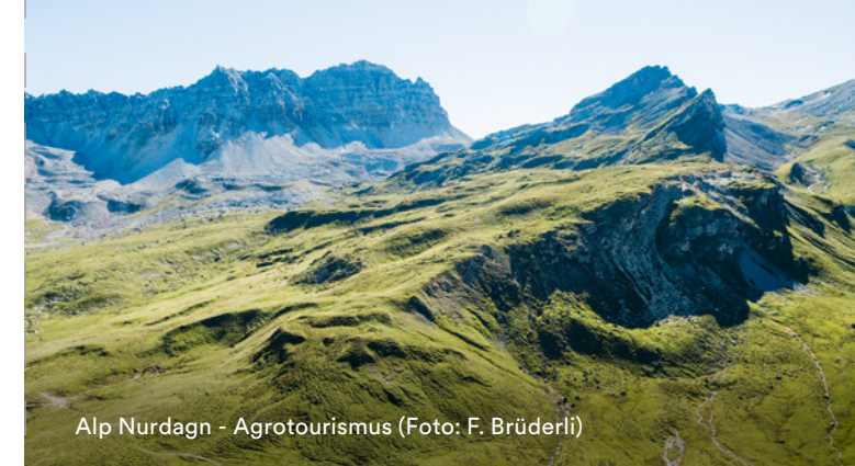
Alp Nurdagn - Agrotourismus

Gruppen ab 6 Personen, Extrafahrten und Fahrräder auf Anfrage.