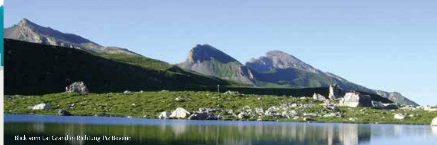
Blick vom Lai Grand in Richtung Piz Beverin