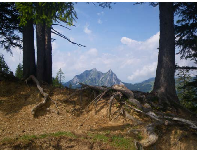
Wanderung im Banne der Mythen