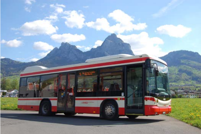
Bus mit Mythen im Hintergrund