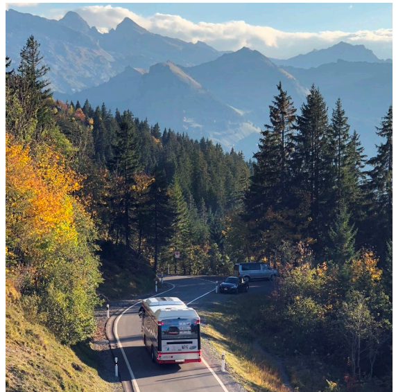
Ibergeregg-Bus vor schöner Panoramakulisse Bildnachweis: zvg