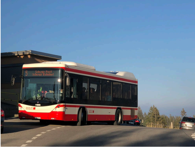
Der Ibergeregg-Bus im Einsatz in der Mythenregion