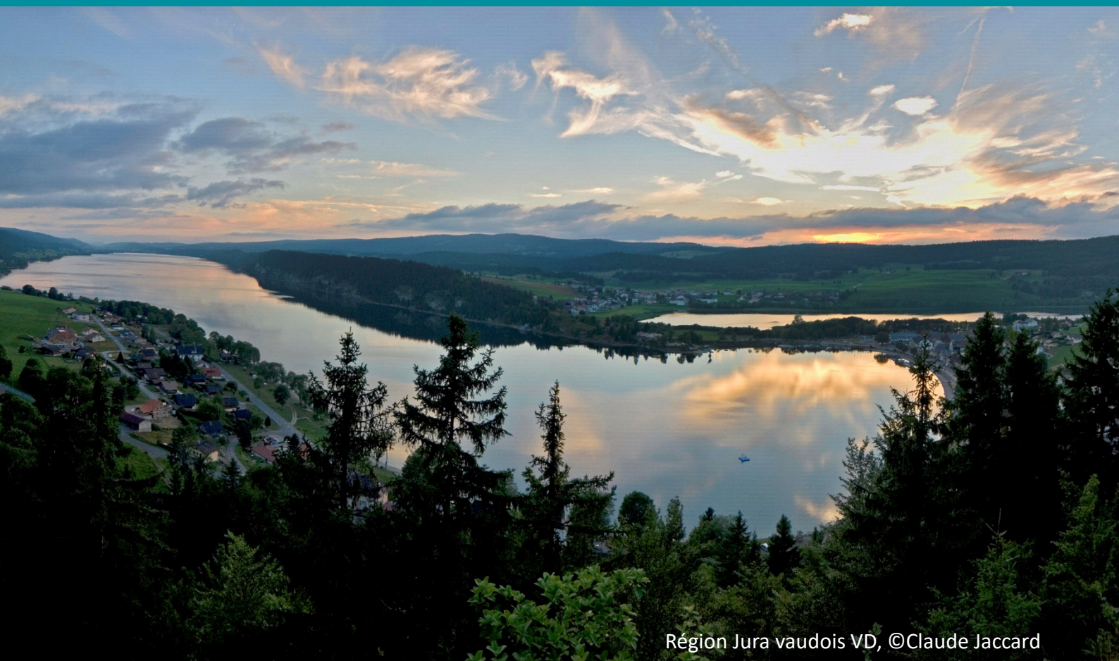
Région Jura vaudois VD